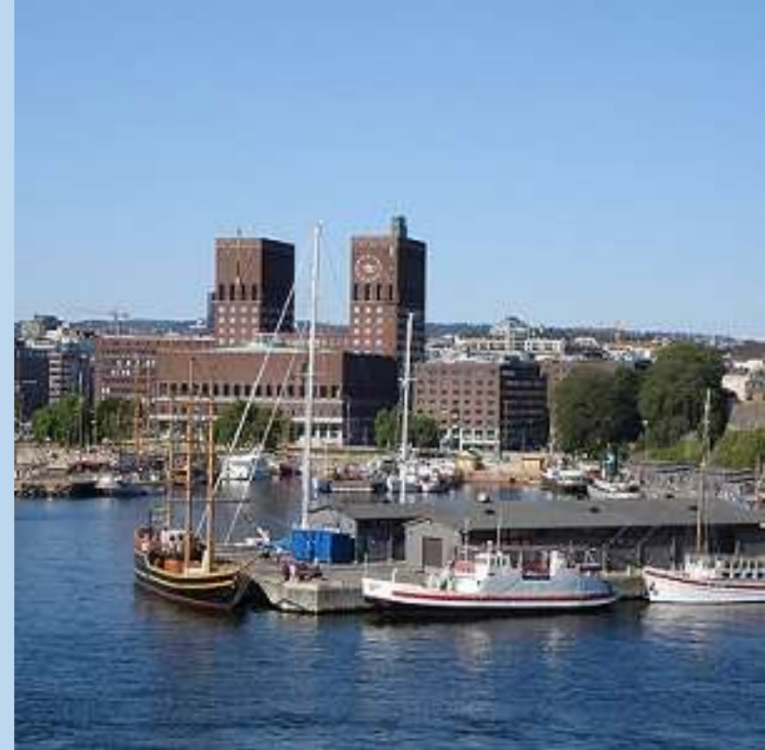
Brodaska luka u Oslu