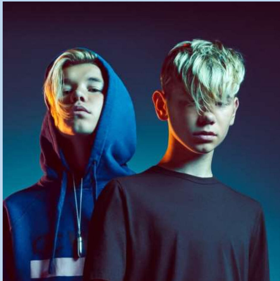
Marcus & Martinus