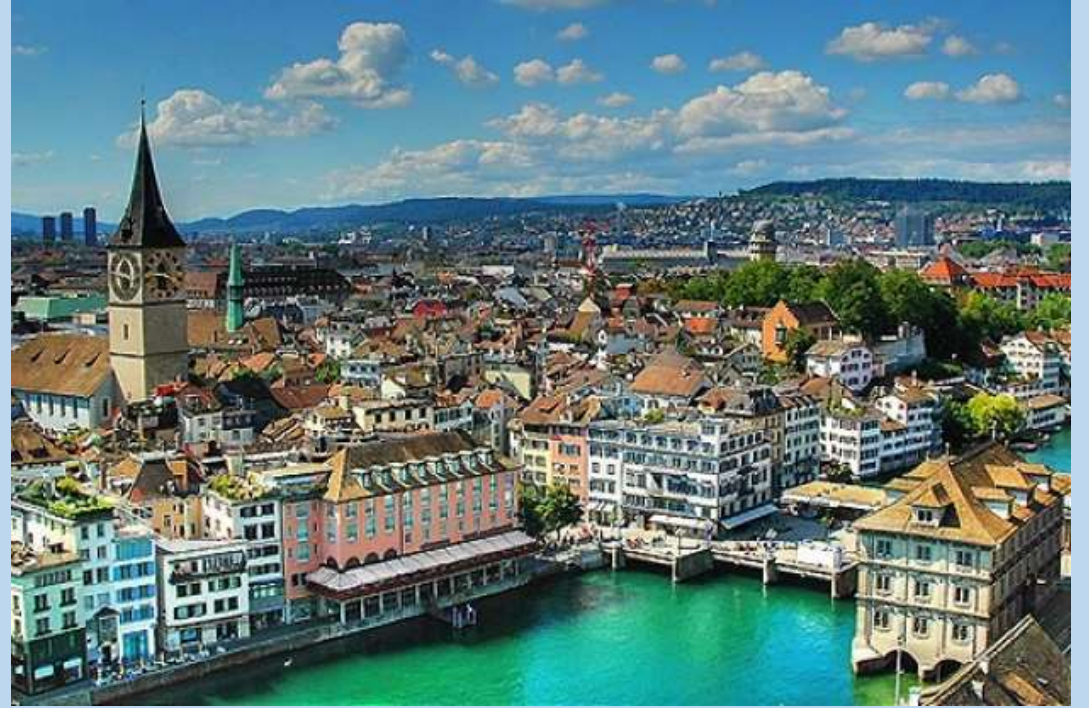
Oslo iz zraka